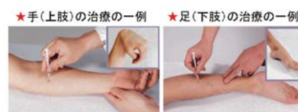
※わかりにくい場所にある筋肉に注射をするときには神経探索刺激装置や超音波装置を使うことがあります

るので、緊張して困っている筋肉一つ一つに注射をしていきます。実際の治療では、多いときには10カ所以上の筋肉に注射することもあります。わかりにくい場所にある筋肉に注射をするときには神経探索刺激装置や超音波装置を使い確実に効果ができるようにしていきます。 【まとめ】 ・ ボツリヌス療法は、注射で筋肉の過度な緊張を和らげる新しい治療法です。 ・ 治療によって、歩行・動作が楽になる、介護の負担が軽くなるなどの効果が期待できます。 ・ 効果は個人差がありますが、2〜3日であらわれ、1〜2週間で最大に達し、3〜4ヶ月持続します。 ・ 治療の間隔は3ヶ月以上あける必要があります。 ・ 治療の効果を最大限に引きだし長続きさせるには十分なストレッチが必要