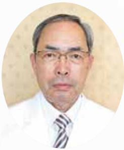
倉敷平成病院 院長

今後も全仁会が地域のために貢献できる組織であり続けるために、2014年も全職員と大きく新しい一歩を踏み出していきたいと思えます。本年もどうぞよろしく願いいたします。