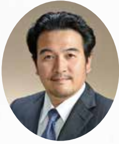
社会医療法人 全仁会 理事長