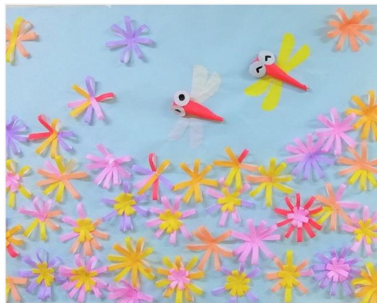
入所者作成「秋桜と赤とんぼ」